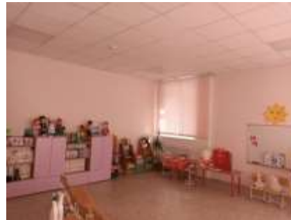
Кабинет по обучению татарскому и русскому языкам